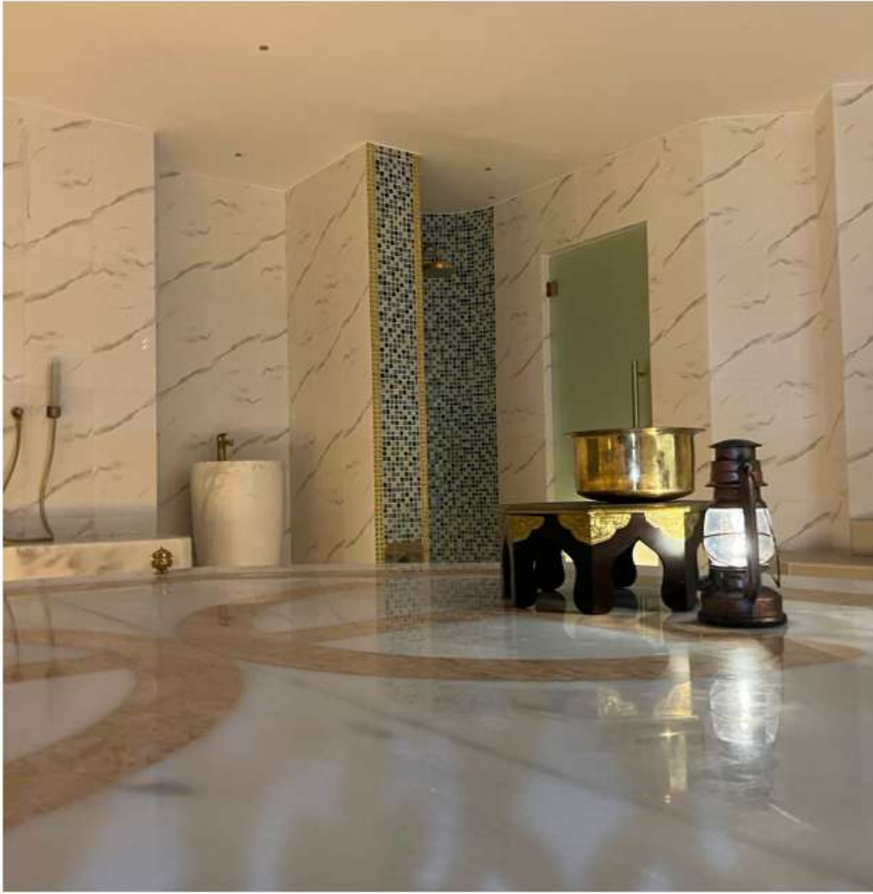
Bluss Now Oriental Hammam @ Al Raha Beach Hotel , Abu Dhabi , UAE